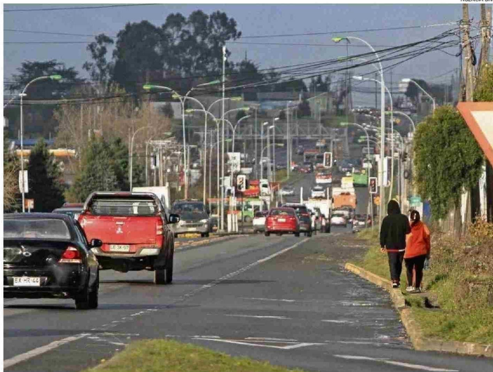
EL ALCALDE CUESTIONA LA PROPUESTA DEL EJECUTIVO Y ASEGURA QUE SE TRANSFORMARÁ EN UN "PROYECTO EMBUDO". POR FALTA DE PISTAS.

de avance en las expropiaciones el próximo año, permitirían avanzar en el inicio de obras, dice el seremi del MOP.