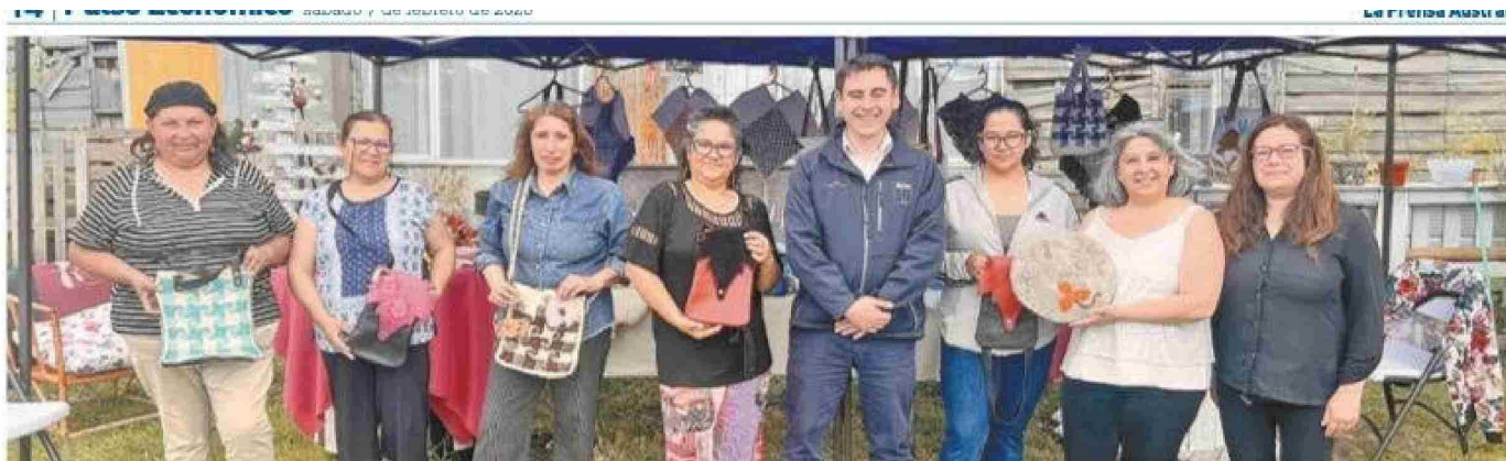
La agrupación cuenta con un punto de comercialización en calle Prat N°92 en Natales

Tiraje: 5.200 Lectoría: 15.600 Favorabilidad: No Definida