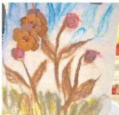
Algunos de los productos elaborados por las artesanas natalinas.

La iniciativa contempló un ciclo de talleres de capacitación donde las participantes adquirieron nuevos conocimientos en técnicas como fusión cuero-vellón, fieltro húmedo y telar con clavos, además de la confección de monederos, bolsos y separadores. Junto con ello, recibieron financiamiento