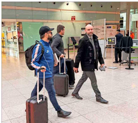
El exmandatario vestía botines, una chaqueta del club de la UC y un jockey. También llevaba el libro "La fábrica de papel".