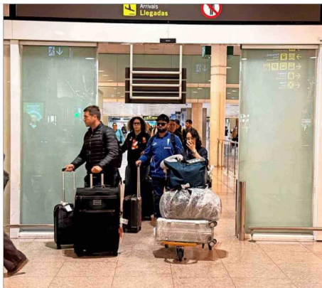
A las 8 de la mañana, hora local, llegó el expresidente Gabriel Boric a Barcelona, proveniente de Madrid.