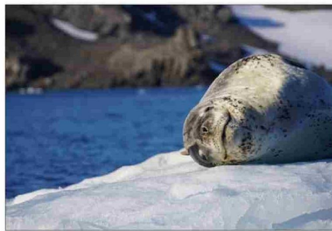
Una de las máximas atracciones es ver la fauna de un lugar extremo.

nativa distinta para este tipo de viajeros. "Una de las razones por las cuales personas con mayor fama visitan el último confin del mundo es la exclusividad. No es un viaje barato ni al que cualquiera pueda acceder", señala.