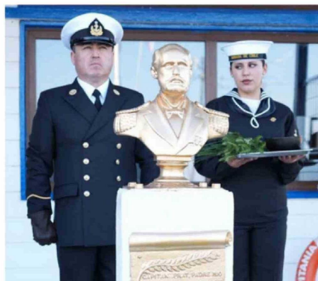
HERMOSAMIENTO Y NUEVA UBICACIÓN PARA EL BUSTO DE PRAT.