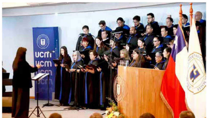
Al cierre de la ceremonia, el coro de la casa de estudios interpretó el himno institucional, sellando con sus melodiosas voces este importante hito académico.