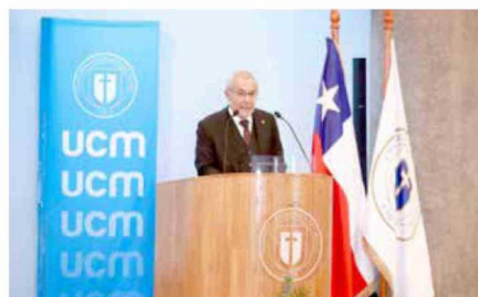
El rector de la UCM, Claudio Rojas, lideró la ceremonia, instancia donde expresó que la misión de la casa de estudios va más allá de la entrega de conocimientos, debido a que están llamados a formar personas íntegras, con sentido crítico, compromiso social y vocación de servicio.