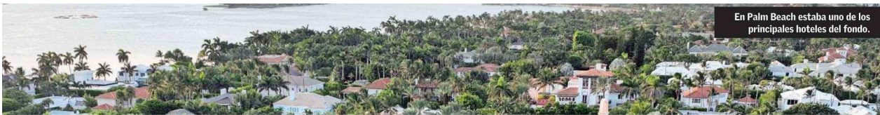
En Palm Beach estaba uno de los principales hoteles del fondo.

Cinco hoteles y una millonaria querrela por “administración desleal”: