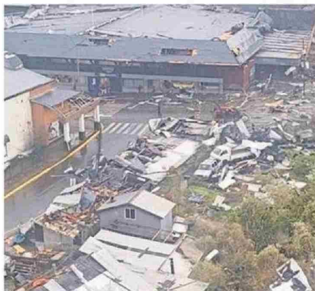
El fenómeno fue registrado en numerosos videos de habitantes.

Antes, el director regional de Senapred de Los Lagos, Mitzio Ri-