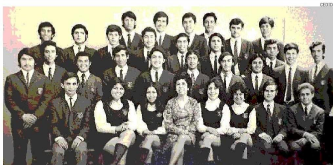
En medio de la primera promoción de alumnos de Electrónica del Liceo Industrial de Viña del Mar.

RECONOCIMIENTO ANUAL A PERSONAS 75+ QUE IMPACTAN EN LA SOCIEDAD