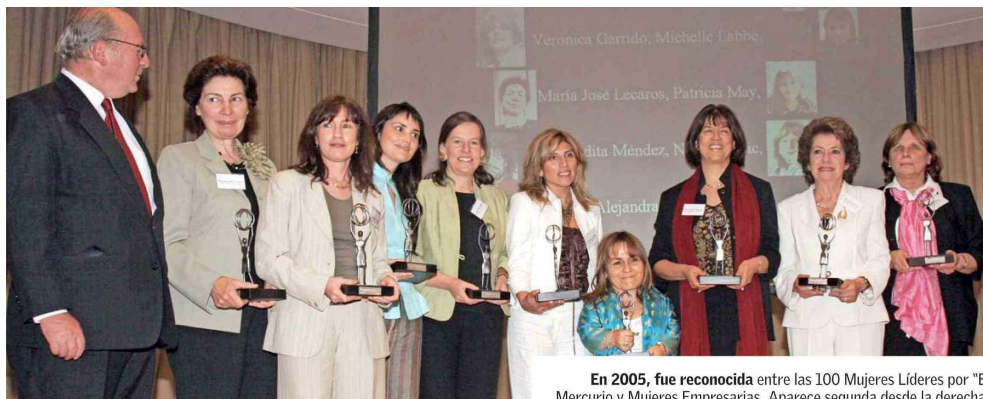
En 2005, fue reconocida entre las 100 Mujeres Líderes por “El Mercurio y Mujeres Empresarias. Aparece segunda desde la derecha.

“Me acuerdo perfectamente hasta de la fecha. Fue el 11 de septiembre de 1963. Yo llevaba apenas cinco meses en la universidad. Acompañé a un compañero a un liceo vespertino, y el inspector me preguntó qué estudia-