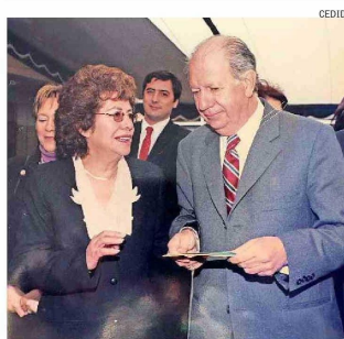
Conversando con el entonces Presidente Ricardo Lagos en el Colegio República de Colombia.

ba. Le dije que matemáticas, y volvió con un libro de clases. Me dijo: ‘Señorita, vaya y tome el curso’. Era un quinto humanidades, lleno de adultos. Yo no tenía experiencia, pero entré igual. Hice lo que había visto hacer a mis profesoras: pasé lista y pregunté qué habían visto la clase pasada. Desde ese día no he dejado de hacer clases”.