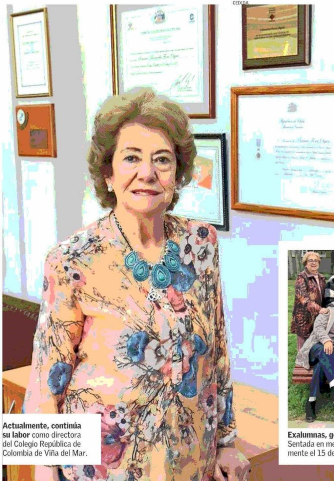
Actualmente, continúa su labor como directora del Colegio República de Colombia de Viña del Mar.

Tiraje: 126.654 Lectoría: 320.543 Favorabilidad: No Definida