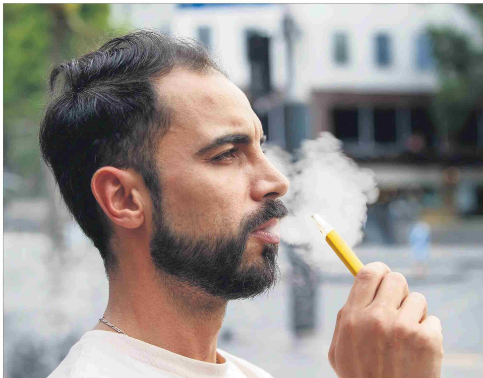
Sólo se permitirá el uso de los vapeadores en espacios abiertos, como ocurre con los cigarrillos.