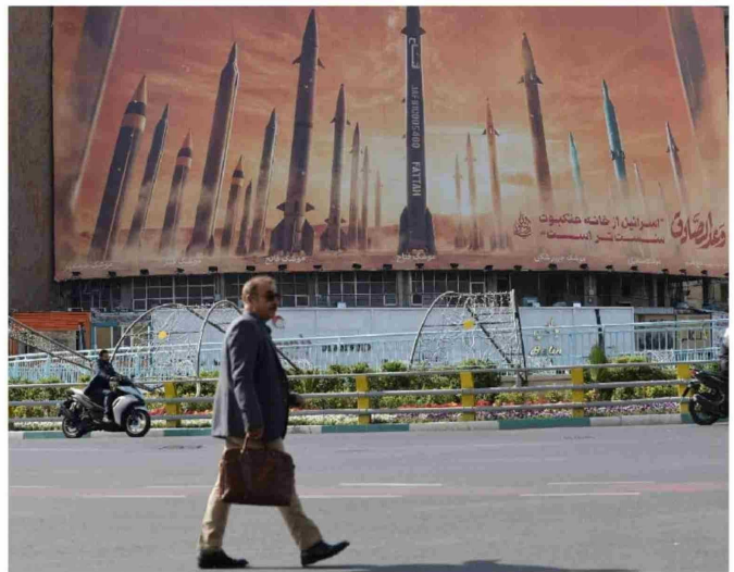
► Un cartel antiisraelí con una imagen de misiles iraníes se ve en una calle de Teherán, Irán.

Poco después de que se escucharan explosiones en Doha, capital de Qatar, el ejército iraní anunció el lanzamiento de la Operación Bendiciones de la Victoria. Los medios iraníes informaron simultáneamente que bases estadounidenses en Irak también fueron blanco del ataque. Los sistemas de defensa aérea fueron ac-