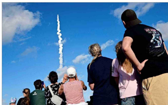
Cerca de 400 mil personas vieron en directo el lanzamiento de la misión Artemis II. En la foto, el público que se apostó cerca del puente A. Max Brewer en Titusville, Florida.

En la previa, los tripulantes de la Estación Espacial Internacional mandaron por video un saludo a sus colegas antes de comenzar el periplo. “Estamos honrados de desear a nuestros compañeros exploradores un buen viaje. A lo largo de la historia humana, la Luna ha despertado