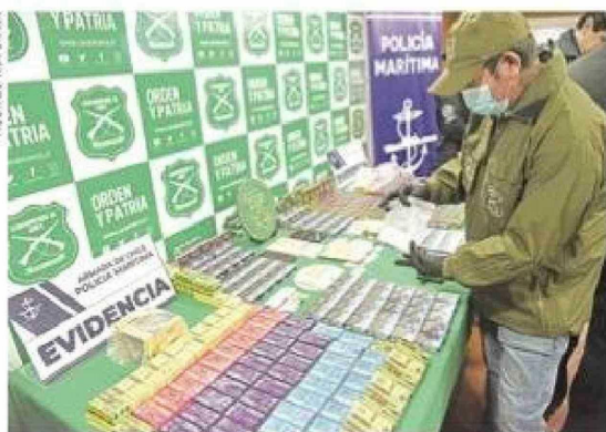
En dependencias del OS-7 de Carabineros fue exhibida la mercancía ilícita.

El fiscal Aguirre dijo que esta incautación se da en el contexto de