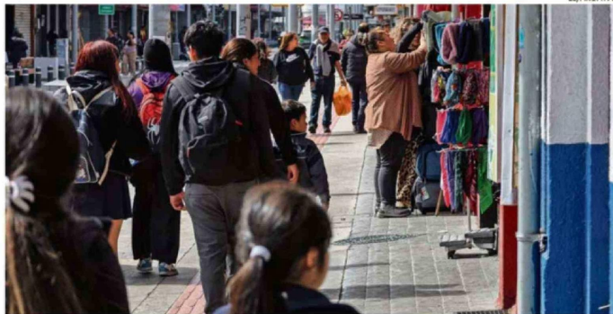
LOS DATOS OBTENIDOS EXPONEN UNA EVALUACIÓN SOBRE LA SITUACIÓN ECONÓMICA, EL MERCADO LABORAL Y LA SEGURIDAD PÚBLICA REGIONAL

El académico añadió que este escenario "no es un problema sólo de desempleo, sino que está atribuido tam-