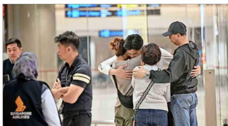
Pasajeros del vuelo abrazan a familiares tras llegar finalmente a Singapur. Además del hombre que falleció, siete pasajeros resultaron gravemente heridos y decenas sufrieron lesiones de menor magnitud.

Equipos de rescate y médicos (en la foto) esperaban al vuelo de Singapore Airlines, que se desvió hacia un aeropuerto en Tailandia.