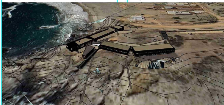
RENDER DE EMPLAZAMIENTO | el hotel considera inicialmente 12 habitaciones en una primera etapa