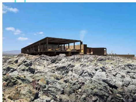
RENDER EXTERIOR HOTEL

EL MODELO CONSIDERA INICIALMENTE 12 HABITACIONES EN UNA PRIMERA ETAPA, CON LA POSIBILIDAD DE EXPANDIRSE A 24 SI EL ESCENARIO DE INVERSIÓN LO PERMITE. SE INCLUYE TAMBIÉN UN RESTAURANTE DE ALTO ESTÁNDAR, UN SPA Y UNA SALA PARA EVENTOS CORPORATIVOS ■