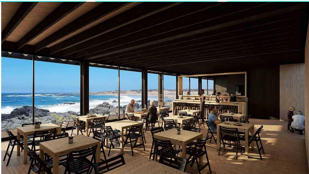
RENDER DE RESTAURANTE