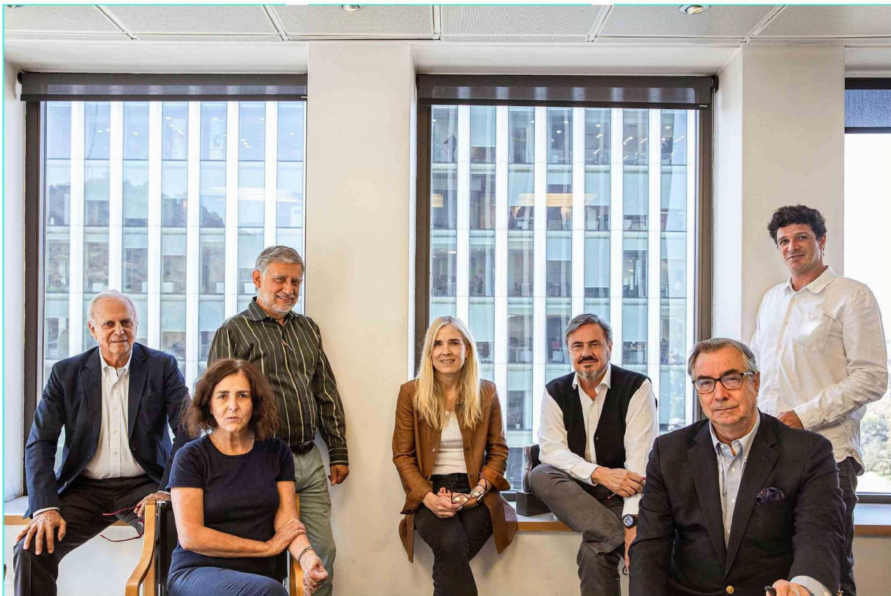
ABWB | Alemparte Barreda Wedeles Besançon Arquitectos y Asociados, a cargo del proyecto de diseño

E l hotel boutique Agua Dulce , parte de un ambicioso desarrollo inmobiliario en Huentelauquén, Región de Coquimbo , combina residencias de alta gama con una propuesta de hospitalidad de bajo impacto y alto diseño. Con una apertura prevista para 2028, el proyecto cuenta con el respaldo estratégico de Fitzroy , firma especializada en turismo y real estate, y con el diseño de los reconocidos estudios ABWB y WMR Arquitectos . La propuesta contempla