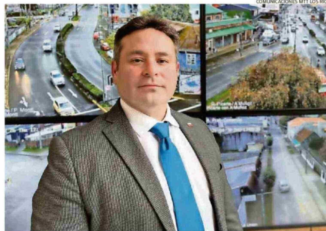
TAMBIÉN COMPLETÓ LA CARRERA DE INGENIERÍA CIVIL INDUSTRIAL EN LA UNIVERSIDAD SAN SEBASTIÁN.

Otro de los desafíos es la conectividad, buscaremos otorgar un mejor servicio a las personas en todas nuestras licitaciones de conectividad en zonas aisladas. Nosotros no solamente tenemos conectividad terrestre, sino que también marítima, lacustre y fluvial. La