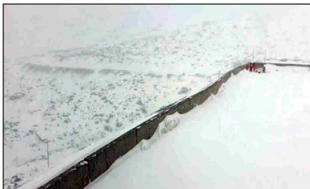
Así luce la Cordillera de Los Andes con la nieve.