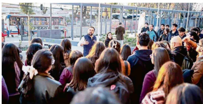
ESTUDIANTES UNIVERSITARIOS, REPRESENTANTES DE ORGANIZACIONES SOCIALES Y AUTORIDADES REGIONALES RECORRIERON LAS INSTALACIONES.

Tiraje: 2.400 Lectoría: 7.200 Favorabilidad: No Definida