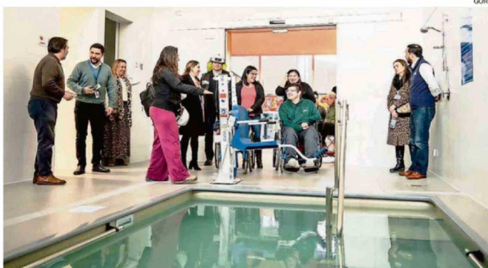
LA VISITA SE REALIZÓ EN EL MARCO DEL WORKSHOP "DISCAPACIDAD E INCLUSIÓN EN ÑUBLE".