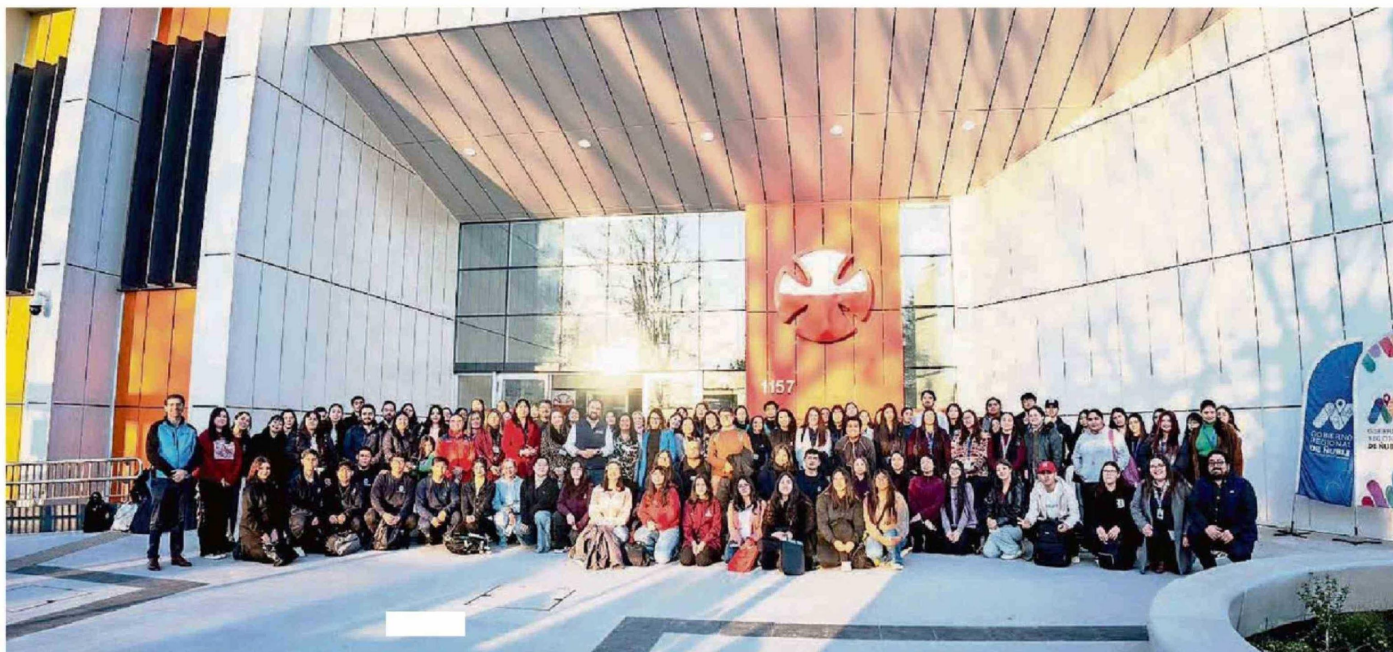
A ACTIVIDAD PERMITIÓ MOSTRAR EL AVANCE DE UNA OBRA QUE BUSCA FORTALECER LA INCLUSIÓN Y EL ACCESO A LA REHABILITACIÓN EN LA REGIÓN.