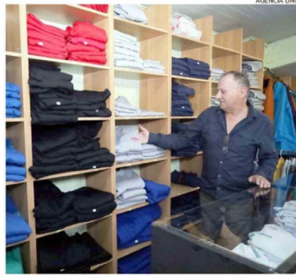
EN CONFECCIONES AICHELE TIENEN STOCK TODO EL AÑO.

aproximadamente las telas, porcentaje que está dentro de los rangos esperados. Pese a estas alzas, los fabricantes locales prácticamente han mantenido sus valores.