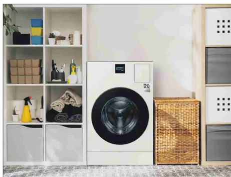
La Samsung Bespoke AI Lite evalúa el nivel de suciedad de la ropa para gastar el agua justa.