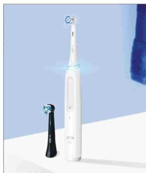
El Oral-B iO 9 arma un verdadero mapa de la boca del usuario.

exactas, monitorea el nivel de pellets y manda avisos cuando su depósito de alimentos de 5 litros se va quedando vacío (mistorechile.cl, https://acortar.link/aZXblv )