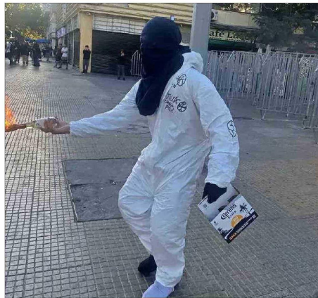
Identifican rol de denominados "fotógrafos" de actos de violencia que serían parte de la organización en ataques en recintos educacionales.

Pero otro de los focos de las pesquisas está sobre hechos