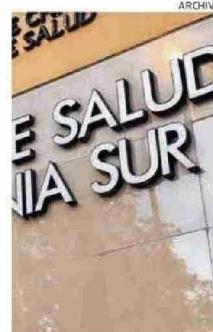
SEGÚN EL SERVICIO DE SALUD LAS CONTRATACIONES SE AJUSTAN ERICTAMENTE A LA NORMATIVA.