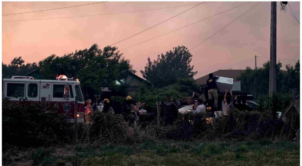
EL ESTADO DE EXCEPCIÓN CONSTITUCIONAL ha permitido el despliegue de las Fuerzas Armadas en las zonas afectadas, con presencia de Ejército, Carabineros y PDI.