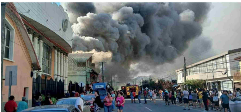
EN LA RUTA Q-90, FRENTE AL SECTOR DE CHILLICO, en la comuna de Laja, se combate un siniestro que ya consume 4.100 hectáreas y amenaza con propagarse hacia Yumbel y Cabrero.