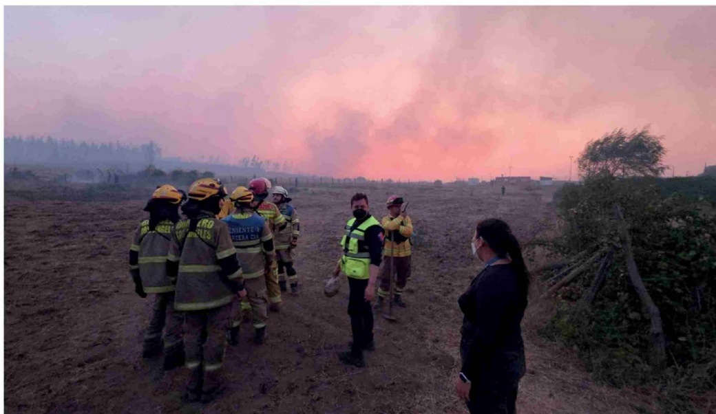
EN EL SECTOR DE ALAMEDA SUR, en la localidad de Santa Fe, Los Ángeles, las autoridades activaron alarmas SAE de evacuación durante la tarde y noche del lunes.

Durante el último balance del Comité para la Gestión del Riesgo de Desastres (Cogrid) de este lunes se informó que existen 573 personas albergadas, 536 viviendas destruidas y 31 incendios en combate en las regiones de Ñuble y del Biobío. Adicionalmente, las autoridades evacuaron diferentes sectores de Los Ángeles, mientras en Laja se combate un siniestro que ya consumió 4.100 hectáreas, con riesgo de propagación a comunas vecinas.