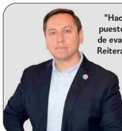
Álvaro Elizalde, ministro del Interior

"Hacemos un llamado a la ciudadanía, puesto que se están emitiendo alarmas de evacuación en el sector de Santa Fe. Reiteramos enfáticamente la importancia de acatar"