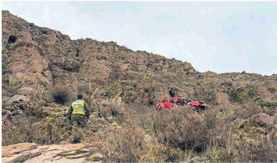
EL COPE DE CARABINEROS LOGRÓ RESCATAR LOS CUERPOS DE LOS DOS FALLECIDOS DESDE LA QUEBRADA.

atro personas que e dirigían a bordo e una camioneta la ruta 15 CH con a Villa Blanca, Colvolcaron la noche ércoles a la altura ómetro 71, entre iza y el sector de . hículo cayó a una da de 500 metros, o como resultado la e de un hombre y rjer. Otras dos perresultaron con dilesiones y fueron adas a recintos de e la región. ccidente ocurrió e las 22:00 horas, a densa neblina en , lo que también vertido por otros tores que transita el sector. íz del desbarranca-del vehículo, se in a los números de encia, llegando al Carabineros de la nisaría de Huara, ros de la comuna, s del apoyo de res del Cuerpo de ros de Pozo Al y ambulancias del