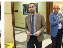
Una intensa jornada en el Congreso vivió el ministro de Hacienda, Nicolás Grau, durante la revisión en la Cámara del proyecto.