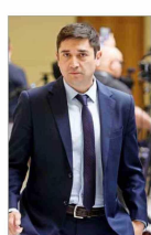
Juzgado suspende la formalización de Miguel Ángel Callisto por fraude al fisco, ante nuevo fuero como senador electo. | C 6

➤ Tampoco avanza la ampliación del giro de negocios de las estatales Correos de Chile y Enap. El Ejecutivo intentará reponer las disposiciones objetadas en el Senado. | B 2