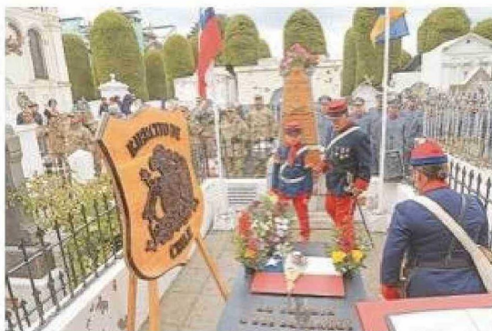
La Agrupación Recreacionista Histórico Militar del General Francisco Barceló Bravo rindió homenaje a los veteranos de 1879.

La actividad fue organizada por la Fundación Huellas Magallánicas y reunió al oficial de ronda de la Guarnición, personal de la Unidad de Servicio y diversas agrupaciones ligadas al mundo militar. Entre ellas participaron la Agrupación Recreacionista Histórico Militar del General Francisco Barceló Bravo, el Círculo de Suboficiales Mayores y Suboficiales en Retiro del Ejército "Héctor Noel Valenzuela Riquelme" y la Agrupación de Personal en Retiro "Más allá del deber".