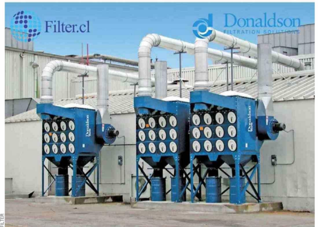
De la mano de Donaldson, Filter asegura rapidez de respuesta y soporte continuo para operaciones mineras.

"Ya sea a través de la consultoría estructural, el monitoreo predictivo y los contratos de gran envergadura en Filter.cl o mediante la inmediatez logística y el acceso directo al catálogo Donaldson que ofrece FilterOnline.cl , el objetivo de fondo permanece inalterable: garantizar que la gran industria minera nunca se detenga", puntualizan desde Filter.