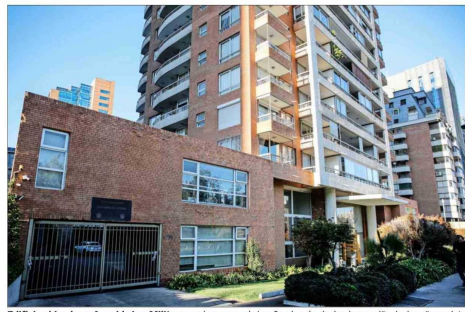
Edificio ubicado en Avenida Los Militares en la comuna de Las Condes, desde donde una niña de dos años y siete meses cayó 11 pisos, perdiendo la vida.

El 4° Juzgado de Garantía determinó que era un cuasidelito y que la pena probable para el imputado se cumpliría en libertad, por lo que rechazó la prisión preventiva y optó por firma y arraigo.