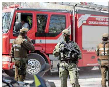
NUMEROS. Actualmente, Chile mantiene distintos números para contactar a Carabineros (133), Bomberos (132) y ambulancias (131).

Así, solo la policía uniformada contabilizó casi 5 millones 700 mil llamadas telefónicas el año recién pasado. Lo anterior, en sus 32 centrales de comunicacion-