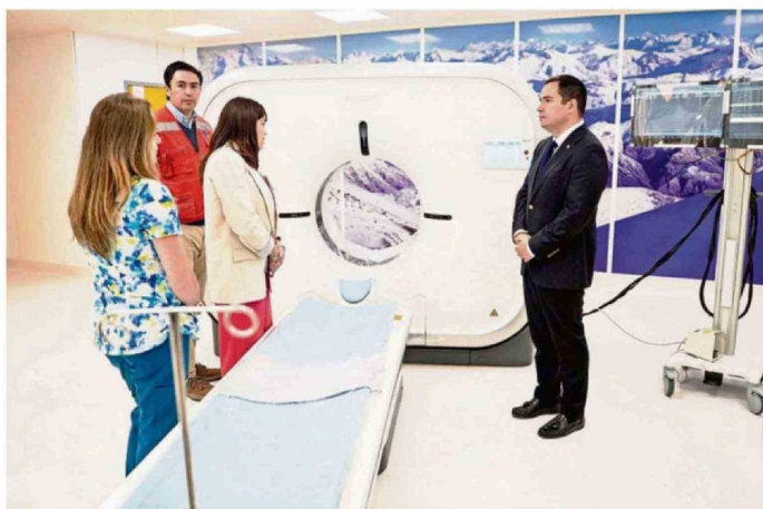
AUTORIDADES REGIONALES RECORREN LAS INSTALACIONES DEL NUEVO HOSPITAL REGIONAL DE ÑUBLE, DESTACANDO SU AVANCE.