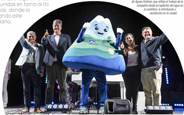
Diversas autoridades junto a Andi, el corpóreo de Aguas Andinas, que refleja el trabajo de la compañía desde la captación del agua en la cordillera, la distribución y recolección en la ciudad.

La Semana del Agua no comenzó con cifras ni diagnósticos técnicos. Se instaló, más bien, como una experiencia que cruzó música, cultura, espacios de conversación y una marcada presencia territorial. Durante varios días, el agua dejó de ser un concepto abstracto para convertirse en un punto de encuentro entre ciudad, comunidad e infraestructura, conectando reflexiones de largo plazo con relatos cotidianos.