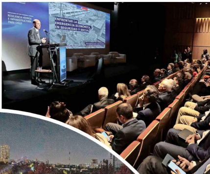
El ministro de Obras Públicas, Martín Arrau, fue el expositor principal del seminario de infraestructura resiliente durante la Semana del Agua.

Cerca de dos mil personas llegaron al Parque de la Familia para el cierre de la Semana del Agua 2026.