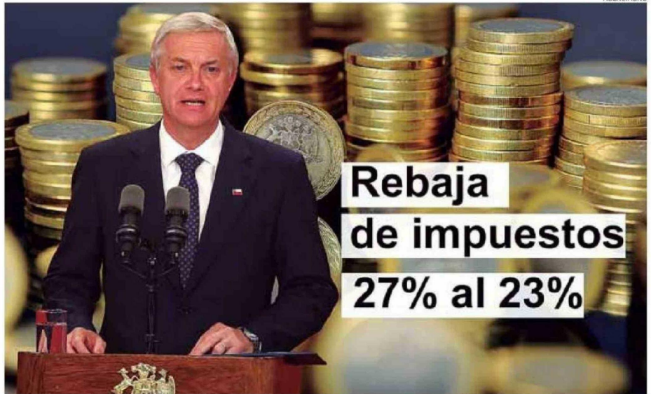
EL PRESIDENTE JOSÉ ANTONIO KAST PRESENTÓ LAS MEDIDAS DEL PROYECTO DE LEY PARA LA RECONSTRUCCIÓN NACIONAL Y DESARROLLO ECONÓMICO.

Se trata de iniciativas que buscan reducir el gasto público, pero también incentivar la inversión que permitan mejorar las cifras de crecimiento, y de ese modo, generar nuevos empleos.