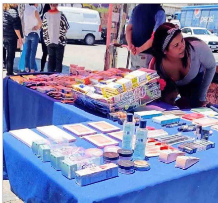
Ante el riesgo de comprar fármacos en locales no establecidos, el año pasado el Gobierno lanzó una campaña contra la venta ilegal de los medicamentos.

“Antes se podía pensar que eran personas individuales que vendían. Hoy se ha revelado que es una red criminal que abastece a una gran cantidad de personas”.