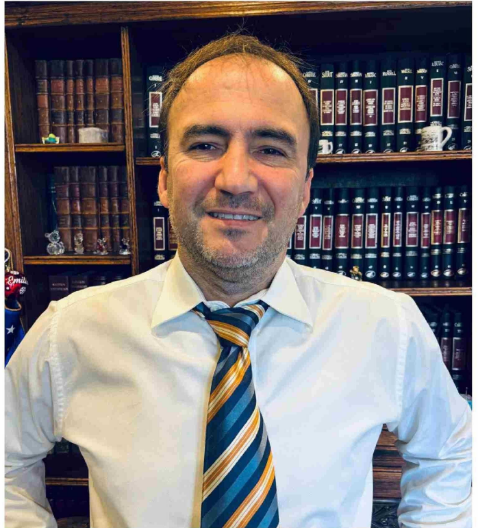
EL SEREMI DE HACIENDA, MANUEL JOSÉ CORREA SILVA, CONVERSÓ SOBRE DIFERENTES TEMAS.

Para recuperar la senda del progreso, no basta con gastar más de lo que se tiene o esperar soluciones sin esfuerzo. Necesitamos crecer, atraer inversión y crear empleos. En los próximos meses trabajaremos intensamente para generar esas condiciones, pero requerimos el apoyo más amplio posible para que esto se concrete".