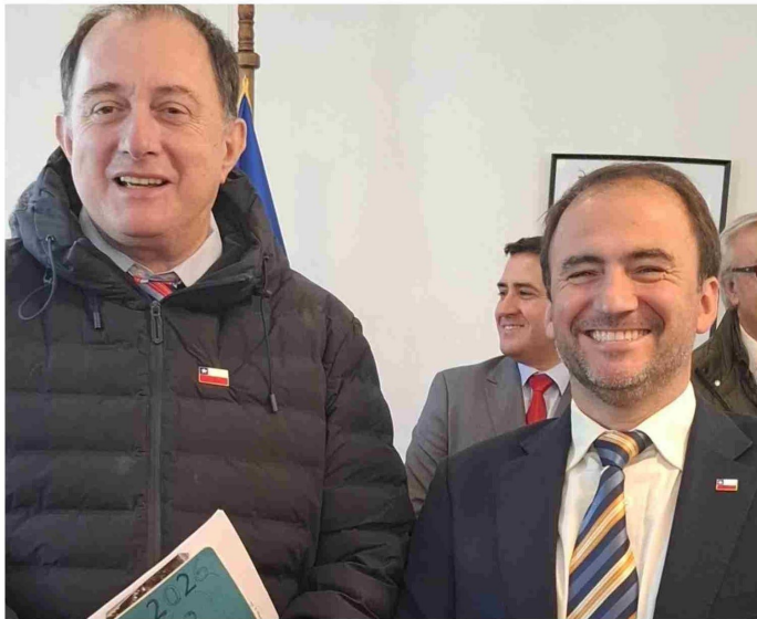
LA NUEVA AUTORIDAD DE HACIENDA COMPARTIÓ CON EL MINISTRO DE VIVIENDA, IVÁN PODUJE.

“El proyecto debe entenderse como un conjunto de medidas que funcionan de manera integrada. Pero quiero destacar tres áreas: empleo, pymes y adultos mayores.