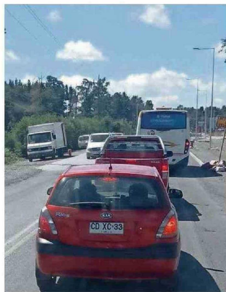
SIEMPRE HAY TACO EN EL INGRESO A VILLARRICA DESDE LICÁN RAY.

"Normalmente se considera que el tramo Temuco-Villarrica tarda una hora. A eso, hoy por hoy, hay que agregarle 30 o 40 minutos de espera en el peaje Quepe. Solo para llegar al ingreso a Villarrica ya hay que considerar una hora y media".