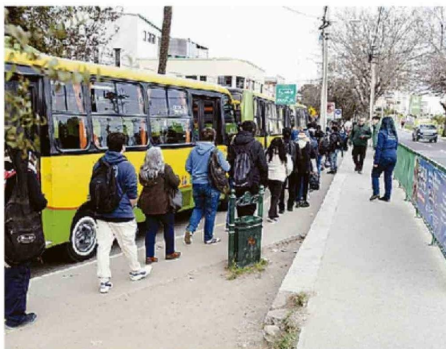
ACTUALMENTE SOLO DOS UNIDADES DE NEGOCIO SE HAN LICITADO.

Como representante de una agrupación nacida con el objetivo de abordar las debilidades del sistema de transporte, expresa que ante esta situación, cobra relevancia la necesidad de propiciar mejoras. "Bien sabemos que el aumento