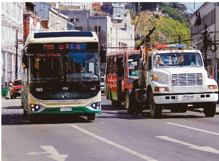
LA IDEA DE LA ANSIADA LICITACIÓN ES LLEGAR A 2.000 NUEVOS BUSES AL TÉRMINO DE LAS TRES ETAPAS.

Su explicación apunta a que esta modificación de comportamientos se da en la población "siempre y cuando tengan un buen sistema de transporte público y los tiempos de viaje les acomoden como para cambiarse de modo de transporte". Dicho de otra forma, la alternativa debe