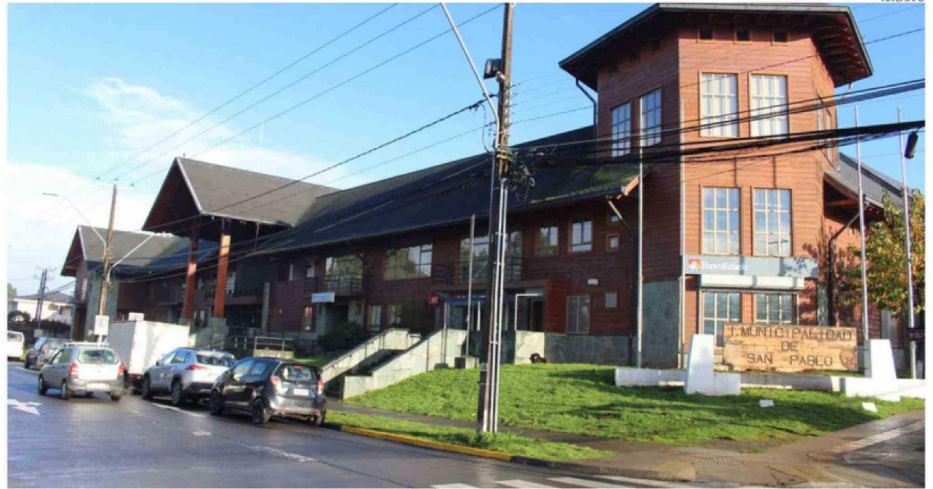
AUTORIDADES COMUNALES DE SAN PABLO ANALIZAN EL IMPACTO FINANCIERO EN LA OPERATIVIDAD MUNICIPAL.

el gasto adicional generado por el reciente aumento del combustible para 2026 en Osorno. Este incremento obliga a recortar partidas en actividades no esenciales.