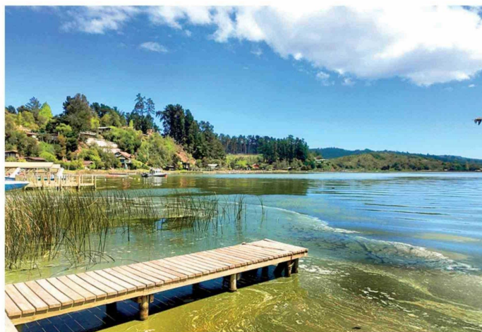
Contaminación de las aguas encendió las alarmas el año pasado.