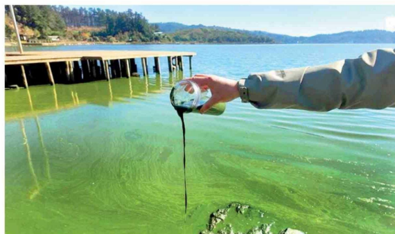
La situación afectó a gran parte del Lago Vichuquén.

Las personas pueden participar hasta el miércoles 3 de junio de 2026, enviando información, estudios, observaciones o antecedentes sobre el sistema lacustre, a los siguientes correos electrónicos: nscalagovichuquen@mma.gob.cl o a oficinadepartesmaule@mma.gob.cl .