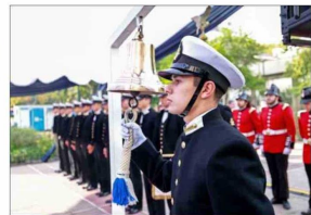
Un aspecto del toque de campana en el acto conmemorativo en Providencia.