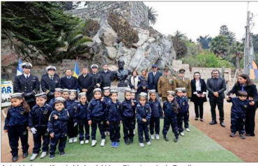
Autoridades y niños de kínder del Liceo Bicentenario de Zapallar.