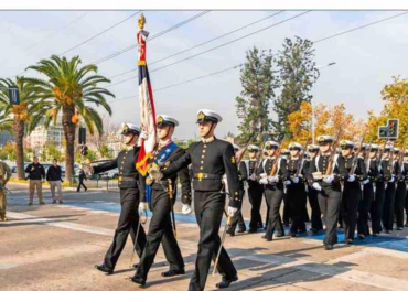
Frente al centro cívico de Vitacura se realizó el desfile conmemorativo.