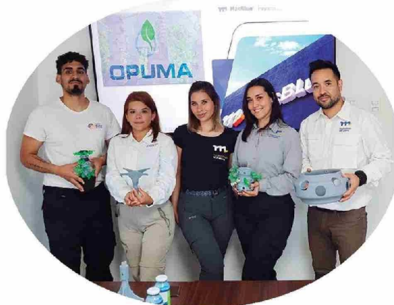
Proyecto Opuma de la línea Innova Región desarrollado por Más Blue.