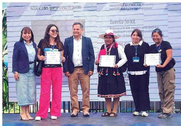
Beneficiarias certificadas en Barrio Playa Brava de Viraliza Eventos "Suma Tarapacá".