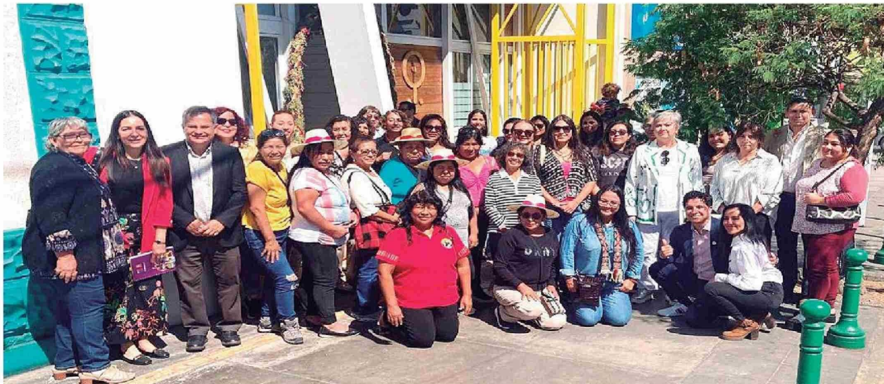
Equipo organizador de proyecto Viraliza Eventos "Suma Tarapacá".