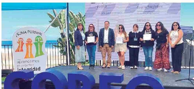
Evento Comercial e Intercultural en Barrio Playa Brava de Iquique del programa "Suma Tarapacá".