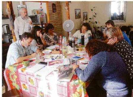
EL LIBRO DE POESÍA TENDRÁ SU LANZAMIENTO EN JULIO DE 2026.

Con las semanas de trabajo, agregó Gutiérrez, se fueron fortaleciendo los vínculos de apoyo mutuo entre las personas y también un proceso de reconocimiento y escucha del dolor del otro y de las formas de expresarlo. Aquello dio paso a que se configurara también "una instancia de