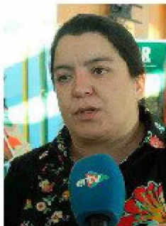
La diputada Natalia Romero valoró el trabajo que están haciendo las Juntas de Vecinos en toda la región.