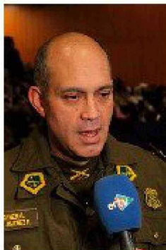
General Max Jiménez

Título: Juntas de Vecinos de O'Higgins recibieron de Carabineros capacitación de prevención