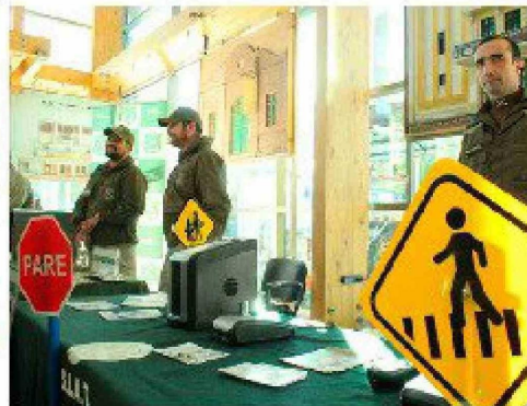
Los asistentes al evento recibieron capacitación por parte de Carabineros para la prevención de incendios estructurales y otras herramientas para evitar siniestros.

Expertos brindaron las herramientas para evitar que se produzcan siniestros, además de medidas de autocuidado en otras áreas.