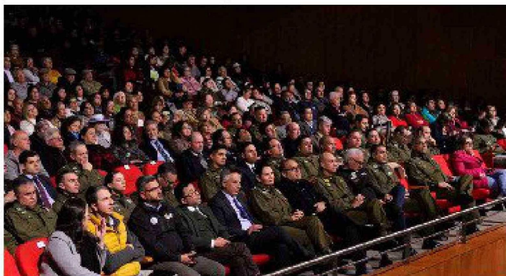
Autoridades de la región y municipales acompañaron a los vecinos en el Congreso de Capacitación a las Juntas de Vecinos.

Expertos brindaron las herramientas para evitar que se produzcan siniestros, además de medidas de autocuidado en otras áreas.