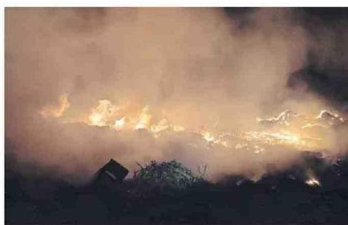
DESDE CONAF LLAMARON A PREVENIR.

"Llamamos enfáticamente a respetar los horarios y condiciones establecidas para las quemas agrícolas. Lo ocurrido en Lluta y Azapa