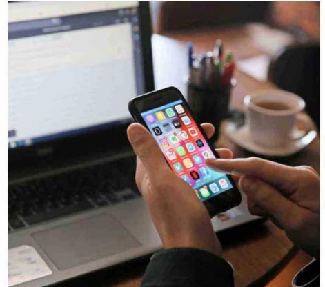
A DICIEMBRE DE 2025 , el 84% de las conexiones fijas a nivel nacional correspondían a fibra óptica hasta el hogar, cifra muy superior al promedio OCDE.

El país lidera los rankings globales en red fija debido al despliegue de fibra óptica y redes de alta capacidad. Sin embargo, expertos advierten que el reto no está en el acceso a infraestructura, sino en la calidad del uso de la conectividad.