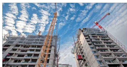
En 2025 se iniciaron 82 obras relacionadas a proyectos de departamentos, lo que representó una baja de 38% anual.

mulación de viviendas que están terminadas, pero no han sido vendidas".