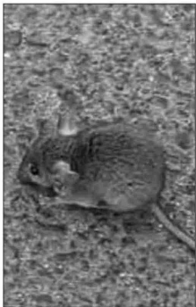
Según se informó, los roedores han nidificado en varios sitios eriazos de distintos dueños.

terreno de mayor extensión pertenece a la empresa Pacal, a la cual el municipio busca contactar para exigir el mantenimiento correspondiente. Existe además un