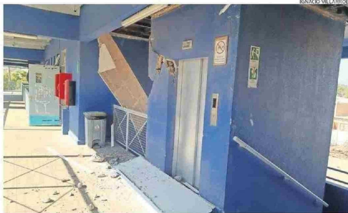
OTRO SECTOR DE LA ESCUELA AFECTADO.

"En general, todos actuaron de acuerdo a los protocolos que están establecidos en el plan integral de seguridad esco-