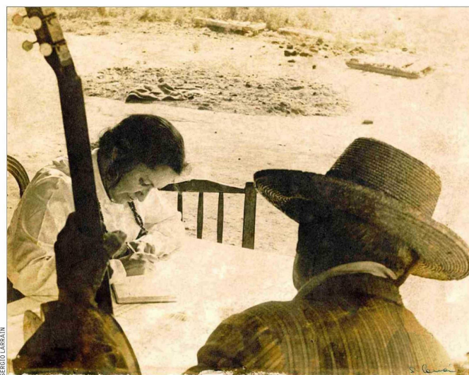
Violeta Parra en sus primeros viajes, aquí en Hualpi, retratada por Sergio Larraín.