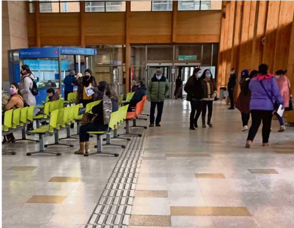
EL EX MINISTRO ENRIQUE PARIS COINCIDE EN MEJORAR LA GESTIÓN, PERO CUESTIONA LA DISMINUCIÓN DE RECURSOS EN ÁREAS CRÍTICAS.