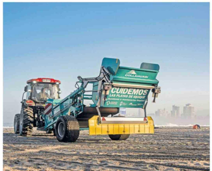
LA MÁQUINA CUENTA CON IMPORTANTES INNOVACIONES PARA UNA MAYOR EFICIENCIA OPERATIVA.